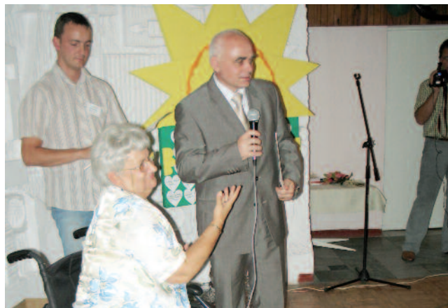
Mirosław Mielniczuk (przemawia)

30 marca 2007 r. Minister Pracy i Polityki Społecznej podpisuje w imieniu Rządu RP Konwencję Organizacji Narodów Zjednoczonych o Prawach Osób Niepełnosprawnych, przyjętą przez Zgromadzenie Ogólne ONZ 13 grudnia 2006 r. 2007 r. rozpoczęcie prac analitycznych dotyczących zgodności prawa polskiego z postanowieniami Konwencji.