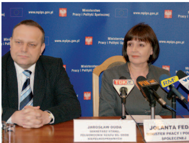
Minister Jarosław Duda i Minister Jolanta Fedak